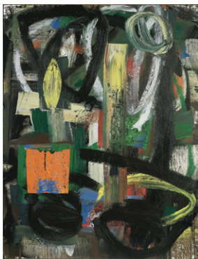
91 10 02, 1991 195 x 150 cm Oil on canvas

Aber dies ist auch die Geschichte zweier Leben die im Innersten und im Sein des Künstlers wohnen, zwei Lebensverlockungen, die sich verbinden, ablehnen und gegenseitig anziehen. Das eine ähnelt dem Sturzbach oder der Gebirgswelt, das andere die Kraft der Formen und ihr Kreislauf. Kann man beide verbinden, sie abrichten und sie zu einer singenden und tanzenden Darstellung verflechten? Muss man diesen Ansturm von Kraft und diese Dynamik fürchten oder soll man diesen Zulauf von geordneten und zurückgehaltenen Motiven verwerfen? Der Traum, dieser flüchtige Strom, erkennt er sich wieder und wird seine Lebendigkeit das Geordnete durchbluten? Zurstrassen beweist uns auf prachtvoller Weise den Erfolg eines solchen Abenteuers, er ist möglich weil er immer ungewiss, aber strahlend von Kraft und Erfindungsgeist bleibt. Die Zerbrechlichkeit an sich muss bestehen bleiben, sie schreckt und stachelt den Marathonläufer auf. „Meine besten Jahre sind vor mir... in mir steckt Feuer... alles ist zu tun“. 8