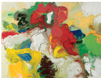
96 12 28, 1996 220 x 270 cm Oil on canvas