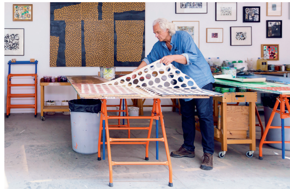
Atelier Uccle, 2018

La couleur dicte le motif. Des aplats vibrants (bleu cobalt, jaune citron) forment des grilles aux traits nets, des constructions géométriques dans lesquelles il insère des éléments découpés, obtenant ainsi des effets de profondeur et de mouvement. Ces jeux de surface et de texture rappellent la pratique du collage et des techniques graphiques, formation initiale d'Yves Zurstrassen. Évidemment, l'usage des papiers découpés évoque Kurt Schwitters, mais c'est surtout l'influence d'Henri Matisse qu'il revendique. Ce même Matisse qui créa un livre intitulé Jazz . Jazz comme improvisation, variation, liberté créative. Trois mots qui résument à merveille le monde de Zurstrassen. En 1947, Matisse « dessinait avec des ciseaux », un demi-siècle plus tard, Zurstrassen lui utilise une machine numérique et du papier journal pour produire des pochoirs qu'il colle et décolle minutieusement, délicatement, pince à la main. Ôter la couleur à la surface du tableau, correspond, dit-il, à ouvrir une fenêtre. Mais hier comme aujourd'hui, l'effet visuel de ces assemblages est le même : il donne une sensation d'ondulation, de « chorégraphie » basée sur l'impulsion et le retrait. Exactement comme Zurstrassen alternant gestes éloquents et plages plus structurées. D'ailleurs n'a-t-il pas appelé l'une de ses toiles Figure Dancing ?