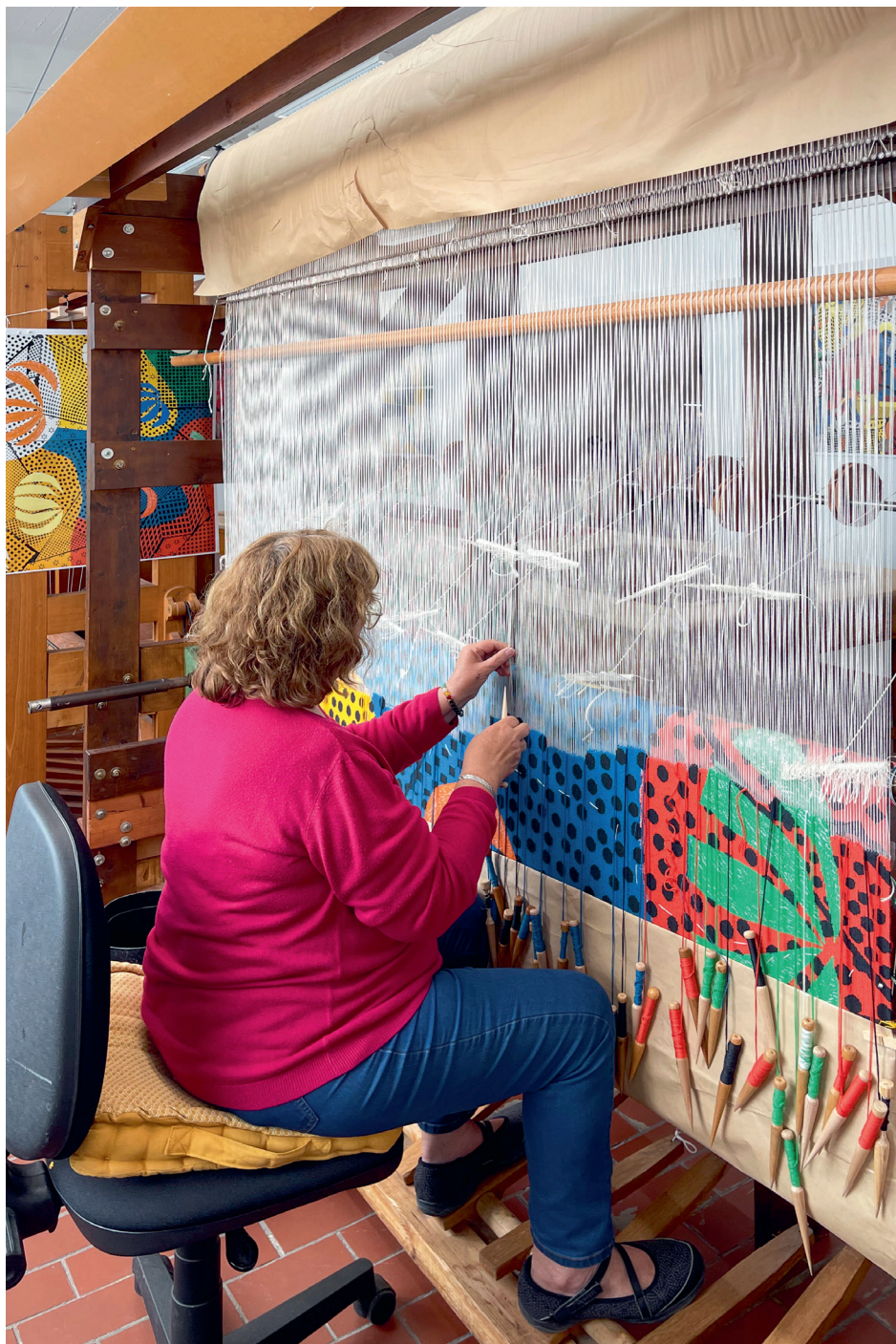
Crecit, Tournai, janvier 2025