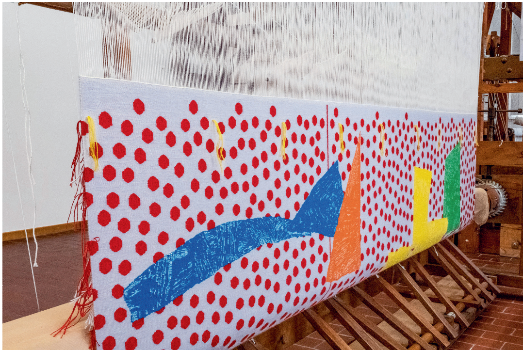
Solar , tombée de métier, décembre 2022, Crecit, Tournai.