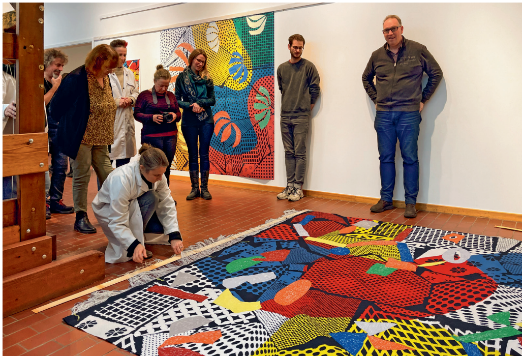
Summertime , tombée de métier, décembre 2024, Crecit, Tournai.

Le 12 décembre 2024, les ateliers de tapisseries du Crecit (Centre de recherches, d'essais et de contrôles scientifiques et techniques pour l'Industrie textile), à Tournai, en Belgique, organisent la tombée de métier de la tapisserie Summertime , inspirée d'un carton d'Yves Zurstrassen. Un événement qui scelle le mariage de la création contemporaine avec un héritage historique.